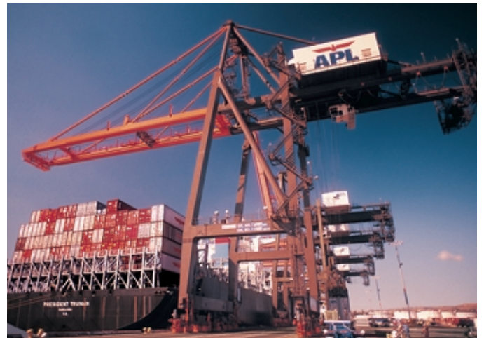
El uso de la tecnología de identificación de carga por rayos x de alta energía en los lugares destinados al embarque de mercancía está aumentando gracias a las iniciativas de seguridad puestas en marcha en todo el mundo.

Varian y el Centro de investigación de Palo Alto (PARC) de Xerox Corporation recibieron una contribución de $5,87 millones de dólares durante el año fiscal 2003 por parte del Departamento de comercio de los Estados Unidos para desarrollar de manera conjunta la próxima generación de sistemas de adquisición de imágenes por rayos X. Se espera que el resultado final de esta investigación conducirá a disponer de una tecnología de inspección por rayos X que sea más rápida, más económica y que permita mayor sensibilidad de detección para la identificación de carga y equipaje en puertos aéreos y marítimos. ■