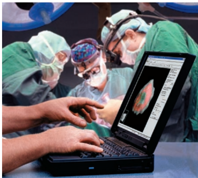
El software VariSeed™ de Varian para planificación de tratamiento intraoperatorio ofrece dosimetría en tiempo real para una colocación más exacta de implantes de semillas en la próstata.

La braquiterapia de alta tasa de dosis administra radiación de alta intensidad directamente en los tumores mediante agujas finas que se aplican a través de poscargadores controlados por computadora que mueven la fuente de radiación por dentro de un cable que se encuentra al interior de la aguja según un plan de tratamiento prescrito. La dosis total se administra en una serie de fracciones o sesiones de tratamiento. Para este tipo de terapia, Varian ofrece los poscargadores VariSource™ y GammaMed™ así como los aplicadores y el software de planificación de tratamiento BrachyVision™.